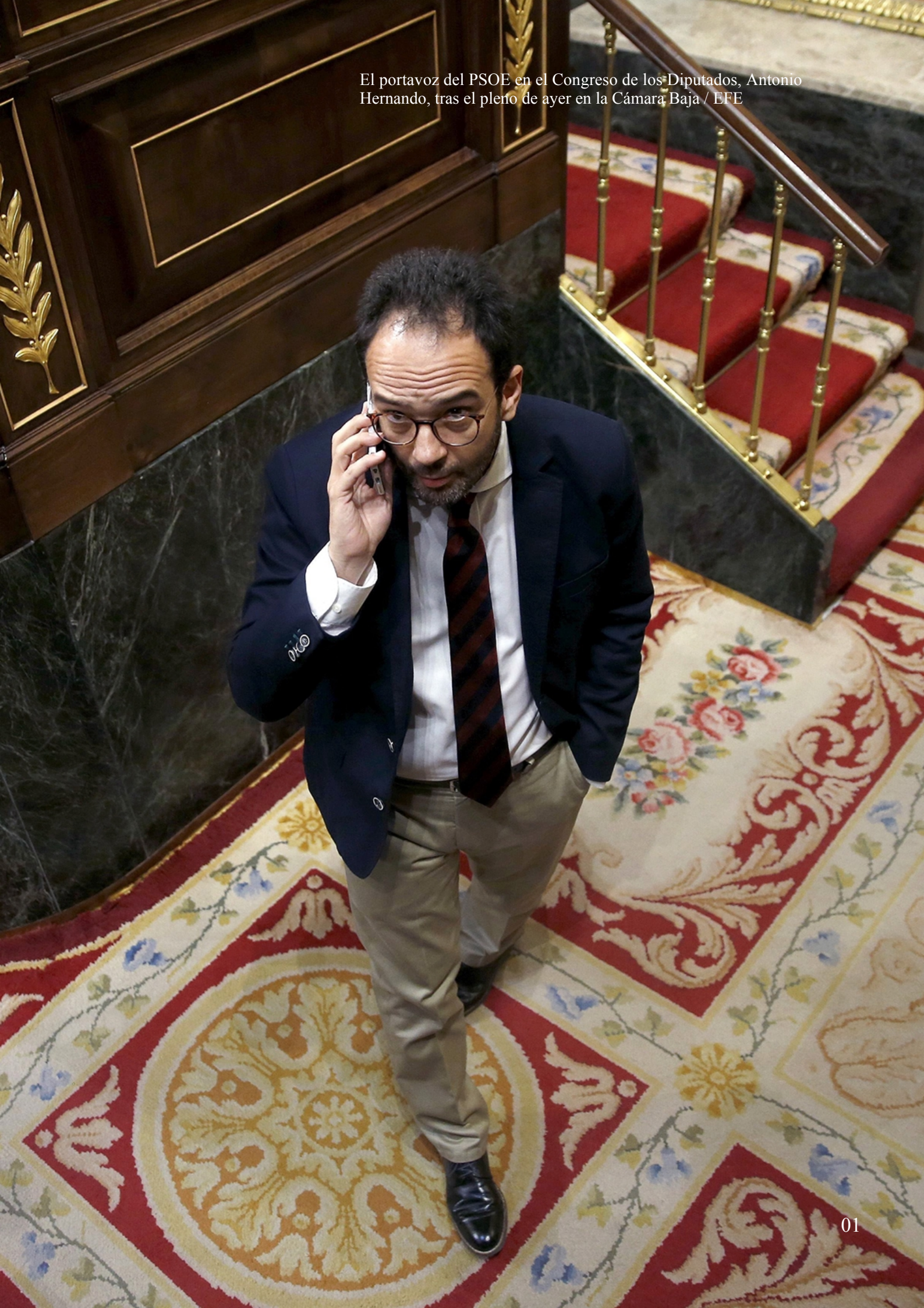
El portavoz del PSOE en el Congreso de los Diputados, Antonio Hernando, tras el pleno de ayer en la Cámara Baja