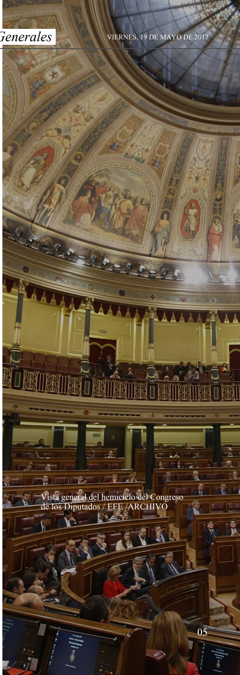
Vista general del hemiciclo del Congreso de los Diputados

La mejora de las actuaciones del Estado frente a esta violencia que cuesta la vida de decenas de mujeres cada año es uno de los objetivos de la subcomisión en la que comprometemos nuestra credibilidad ante la lucha contra la violencia. Esa subcomisión busca también respuestas para que la ley se cumpla y la reparación sea efectiva. La propia Ley 1/2004 mandata a los organismos de igualdad a valorar los programas y acciones que se lleven a cabo y a emitir recomendaciones para su mejora porque el legislador es consciente de que nos hallamos ante una violencia que muta