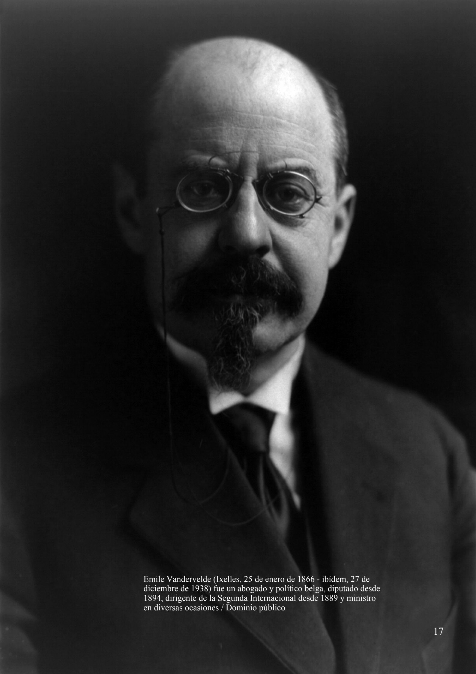
Emile Vandervelde (Ixelles, 25 de enero de 1866 - ibídem, 27 de diciembre de 1938) fue un abogado y político belga, diputado desde 1894, dirigente de la Segunda Internacional desde 1889 y ministro en diversas ocasiones