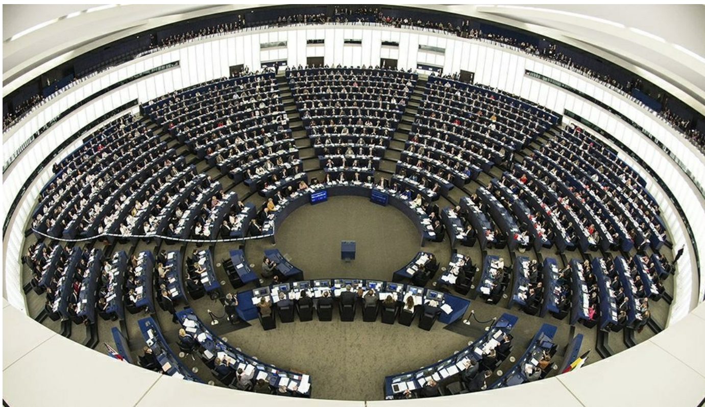
Un sesión plenaria en el Parlamento Europeo