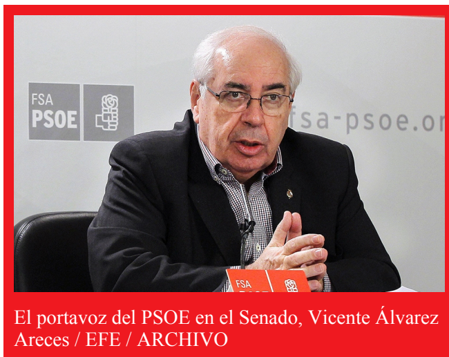
El portavoz del PSOE en el Senado, Vicente Álvarez Areces

El portavoz del PSOE en el Senado, Vicente Álvarez Areces, ha cuestionado el "criterio inédito y antidemocrático" de la decisión del PP y Ciudadanos de bloquear el debate de más de 4.000 enmiendas a los Presupuestos Generales del Estado (PGE) para 2017, "entre ellas algunas que se refieren a Asturias", ha enfatizado. Areces ha destacado la gran importancia de que se tramiten las 6.000 enmiendas presentadas por todos los grupos