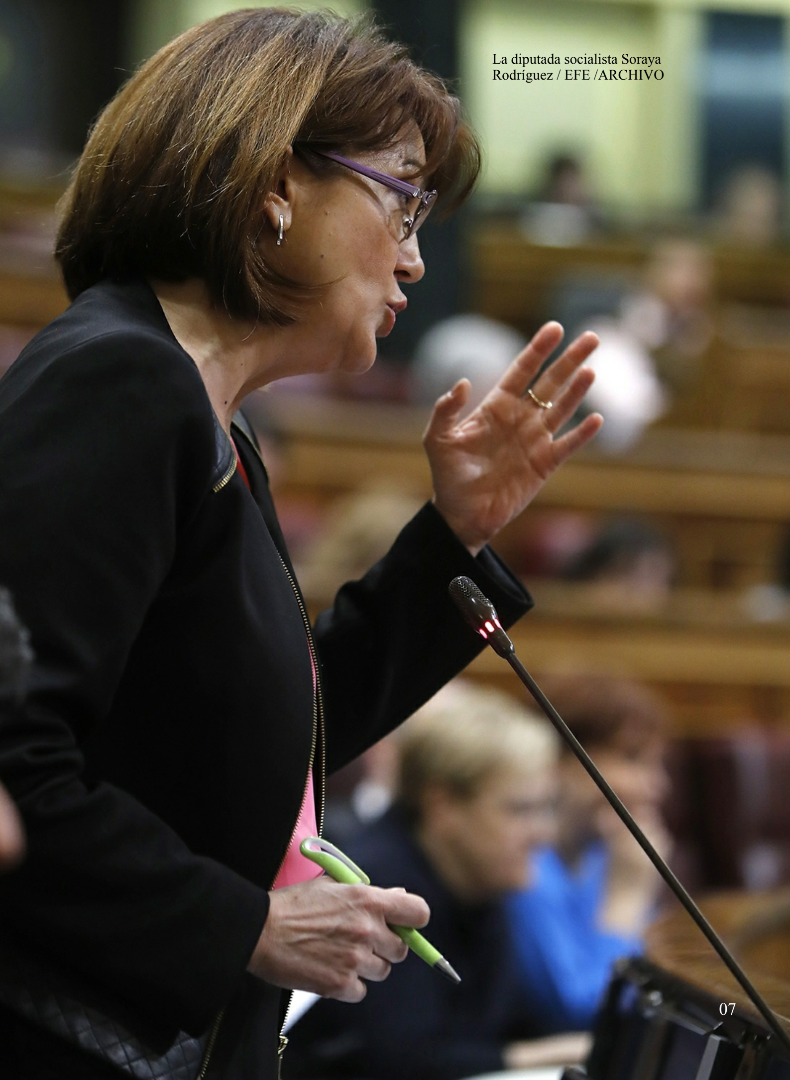
La diputada socialista Soraya Rodríguez